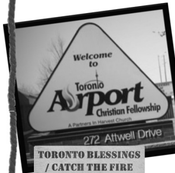
TORONTO BLESSINGS / CATCH THE FIRE